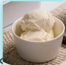
低温・冷凍 食材温度管理