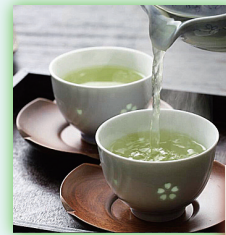
煎茶やコーヒー の温度管理