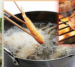
揚げ油の温度管理