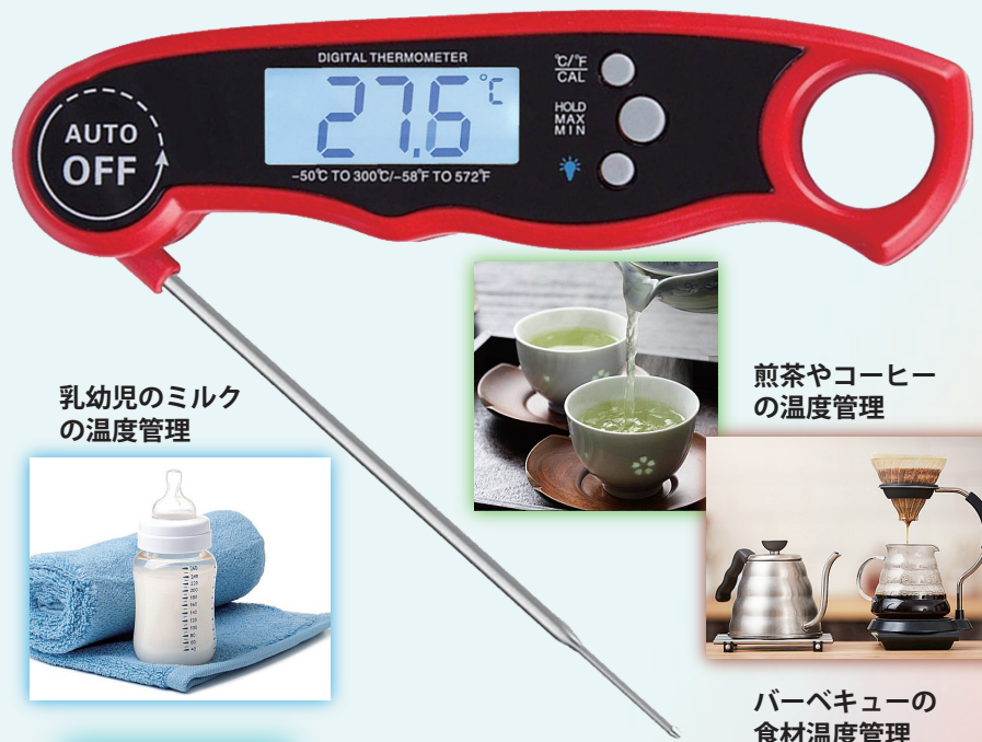
乳幼児のミルク の温度管理

家庭調理やキャンプ・ バーベキュー調理での 食材の生焼き・生煮え予防に 揚げ油の温度管理に 乳幼児用ミルクの温度管理に 煎茶やコーヒーの適正温度に 低温・冷凍食材等の 適正温度を要求される調理に 様々な食材管理に活用出来ます 測定範囲は -50℃～300℃までと ワイドレンジに測れます 測定時間もわずか2～4秒と素早く