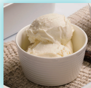
低温・冷凍 食材温度管理