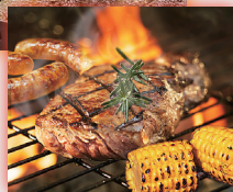
バーベキューの 食材温度管理