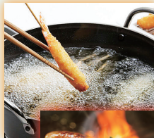
揚げ油の温度管理

家庭調理やキャンプ・ バーベキュー調理での 食材の生焼き・生煮え予防に 揚げ油の温度管理に 乳幼児用ミルクの温度管理に 煎茶やコーヒーの適正温度に 低温・冷凍食材等の 適正温度を要求される調理に 様々な食材管理に活用出来ます 測定範囲は -50^{\circ}\text{C} \sim 300^{\circ}\text{C} までと ワイドレンジに測れます 測定時間もわずか 2 ~ 4 秒と素早く