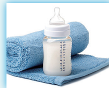
乳幼児のミルクの 温度管理