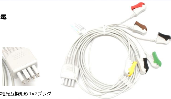
日本電光互換矩形4×2プラグ