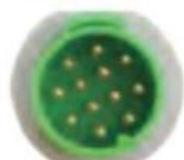
フクダ電子互換旧型12ピンプラグ