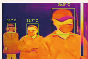
温度分布の可視化イメージ