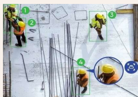
保護具着用検知のイメージ