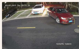
夜間でもカラーで監視