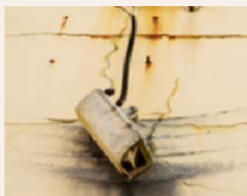
腐食によるカメラ脱落の イメージ