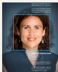
顔認証のイメージ