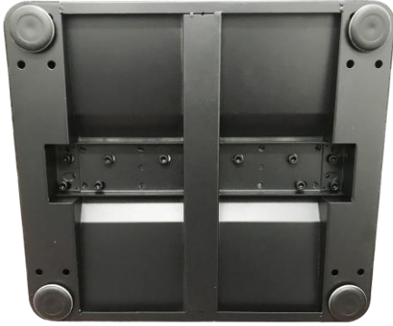
完成後の土台底面