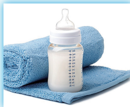
乳幼児のミルク の温度管理