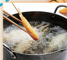
揚げ油の温度管理