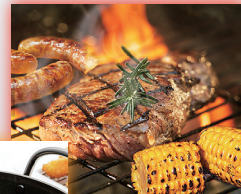
バーベキューの 食材温度管理