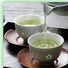
煎茶やコーヒー の温度管理