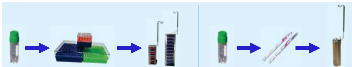
2mLチューブ 凍結ボックス 角型ラック 2mLチューブ ケーン キャニスター