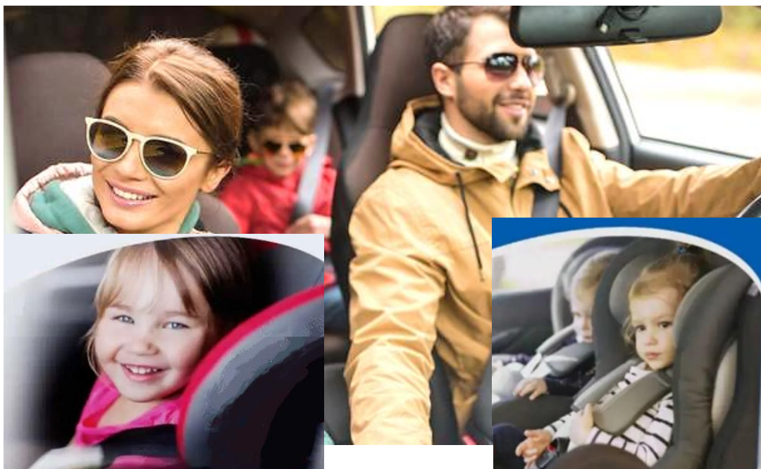
チャイルドシート 1 席用基本セット

走行時の子供のチャイルドシートからの立ち上がりや座り位置のずれなど、ヒヤリハットや車内置き去りなどのヒューマンエラーをアラーム音と発光 LED で防ぎます。