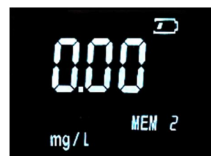
記録番号:2 の表示例